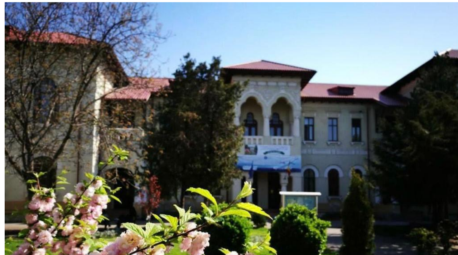
Colegiul Național Pedagogic „Constantin Brătescu” în bătaie magice ale soarelui de toamnă.