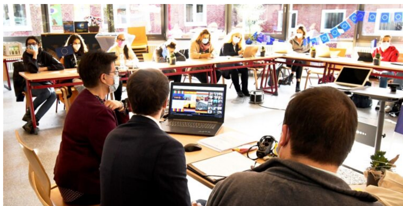
Participarea la întâlnirea finală a mobilității, alături de presa locală și primarul orașului Waltrop.

Proiectul eTwinning „A memoir of loyalty and resistance” și-a propus să reconstituie pagini uitate ale istoriei recente europene și naționale ale secolului XX. Tema Rezistenței împotriva regimurilor totalitare este mai puțin cunoscută de elevi. Aceasta a fost studiată utilizând documente de arhivă, filme etc. Produsul final a fost o expoziție virtuală cu lucrările elevilor participanți. Elevii din clasa a XI-a D au fost activi și implicați pe întreg parcursul proiectului. Partenerii din proiect au fost instituțiile: Ibrahim Kodra, Durres, Albania, Lokman Hekim Anadolu Lisesi Yüreğir Turcia, Liceo Statale „A. Manzoni”, Caserta, Italia, OS „Jovan Dučić”, Belgrad, Serbia, Colegiul Național Spiru Haret, Tecuci, România, Școala Gimnazială nr.2 Videle, România. Proiectul a primit recunoașterea europeană Certificatul European de Calitate.